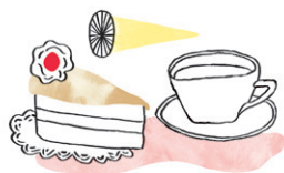
Kaffee und Kuchen

Bei einer Auswahl an alkoholischen und alkoholfreien Getränken begrüßen wir Sie und Ihre Gäste. Bei schönem Wetter gerne im Freien. Der Highball Ihrer Wahl wird bis zum Beginn des Abendessens serviert.